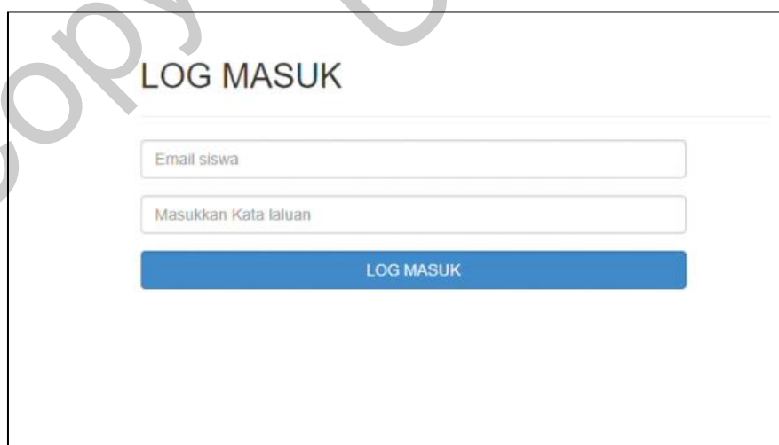
Rajah 2 Log Masuk