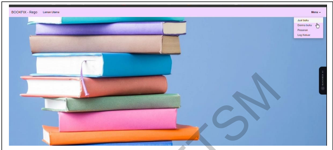
Rajah 3 Muka hadapan