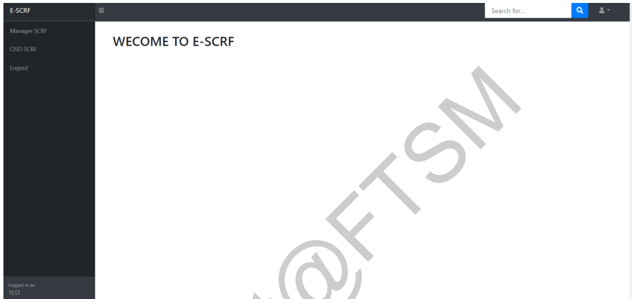
Rajah 4.4.5 – Antara muka pihak Pengurus/CISO

Antara muka pihak pengurus dan CISO yang mempunyai fungsi untuk meluluskan, membatalkan dan melihat senarai permohonan pertukaran.