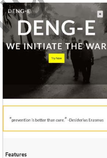
Rajah 3: Antara muka pada peranti mudah alih bersaiz kecil.

Pengujian antara muka mudah alih pula menguji antara muka yang terpapar pada peranti mudah alih pengguna. Antara muka ini sepatutnya mesra pengguna dan boleh diselaraskan walaupun pengguna melayari aplikasi sesawang ini pada mana-mana peranti sama ada pada komputer peribadi ataupun peranti mudah alih.