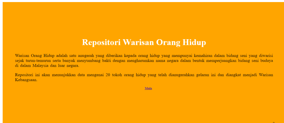
Rajah 2 Muka depan Antaramuka Repositori Warisan Orang Hidup