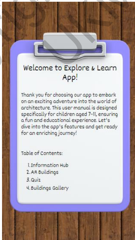
Rajah 2 Antara Muka Manual Pengguna

Panduan Pengguna akan memaparkan halaman dengan arahan tentang cara menggunakan setiap fungsi aplikasi ini seperti di Rajah 2.