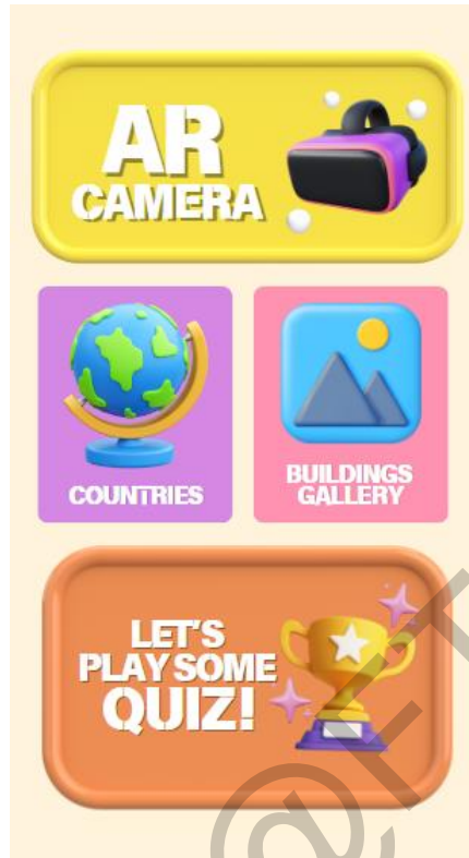
Rajah 1 Antara Muka Menu Utama

Panduan Pengguna akan memaparkan halaman dengan arahan tentang cara menggunakan setiap fungsi aplikasi ini seperti di Rajah 2.