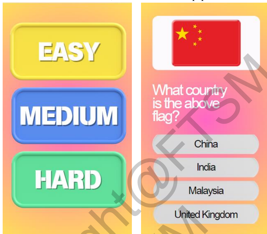
Rajah 6 Antara Muka Sudut Kuiz

Seperti yang ditunjukkan dalam Rajah 6, Bahagian Kuiz akan membawa pengguna ke halaman tahap kuiz di mana terdapat pilihan kesukaran kuiz (mudah, sederhana, sukar). Pilih satu dan jawab 10 soalan. Di akhir kuiz, markah kuiz akan dipaparkan.