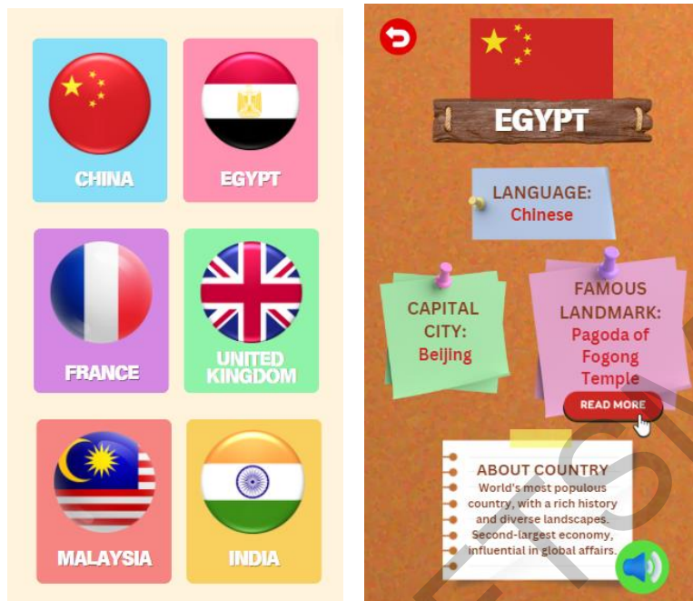
Rajah 4 Antara Muka Sudut Negara

Galleri Bangunan adalah galeri kad penanda bangunan untuk AR. Pengguna boleh mencetak kad tersebut untuk menggunakan kamera AR dengan lancar. Rajah 5 menunjukkan antara muka Galleri Bangunan.