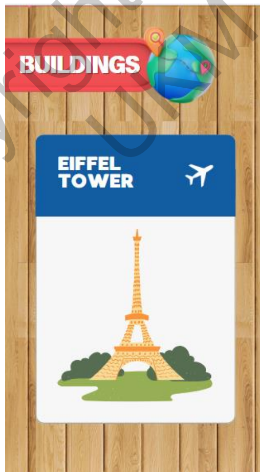
Rajah 5 Antara Muka Galleri Bangunan

Galleri Bangunan adalah galeri kad penanda bangunan untuk AR. Pengguna boleh mencetak kad tersebut untuk menggunakan kamera AR dengan lancar. Rajah 5 menunjukkan antara muka Galleri Bangunan.